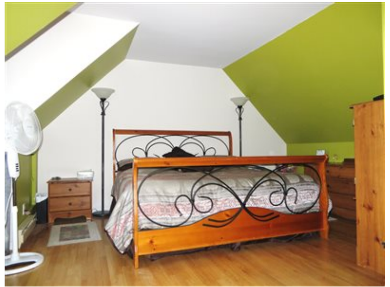
Chambre à coucher principale